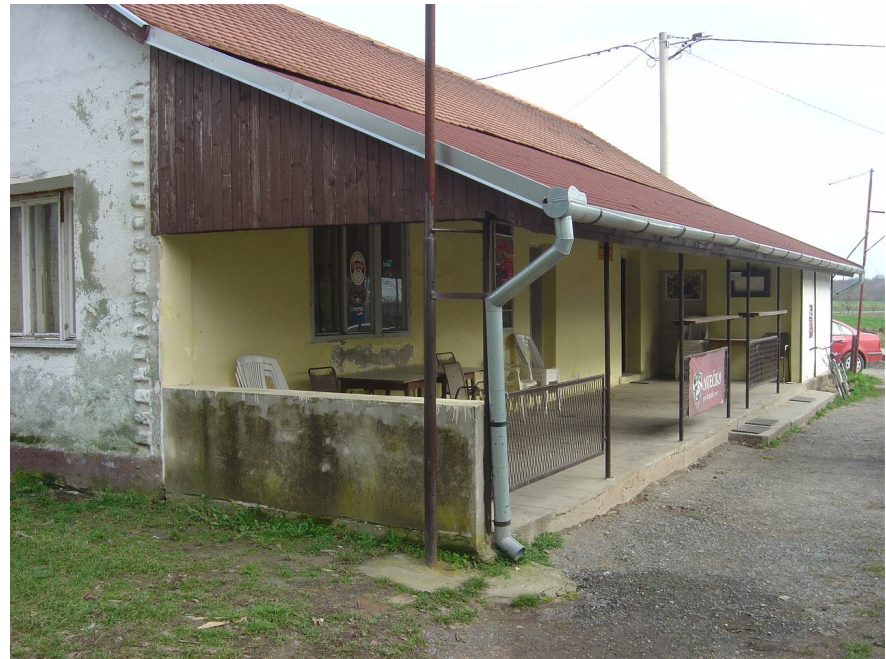
Pripremio: Antun Kedmenec